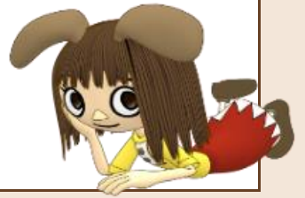
(玉井式国語的算数教室®)